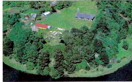
Vista aérea de Iglesia de Colo