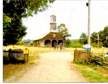
Vista de entrada a Iglesia de Colo