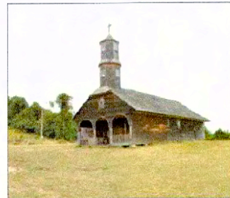
Fachada principal de Iglesia de Colo