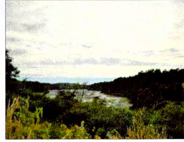
Vista de río